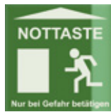
Targhetta pulsante di emergenza Emergency button sign