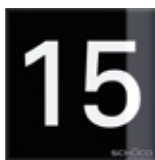
Numero civico House number