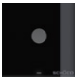
Modulo video Video module