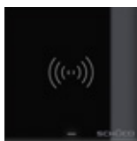
Sensore di movimento Motion detector