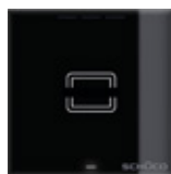
Letture di schede Card reader