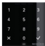
Tastierino numerico Code keypad