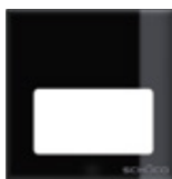
Luce spot LED LED spotlight