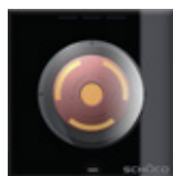
Pulsante di emergenza Emergency button