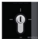
Interruttore a chiave Key-operated switch