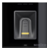
Impronta digitale Fingerprint reader