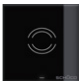
Sensore di prossimità Proximity switch